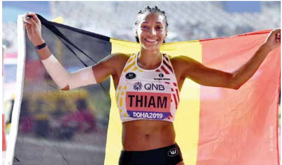
La championne olympique Nafissatou Thiam, a reçu l'aide du "Projet de vie" pour concilier sa carrière sportive et ses études

Au niveau de l'enseignement secondaire (12 à 18 ans), au total des fédérations sportives, 1249 jeunes sportifs sous statut sont identifiés. Ils reçoivent tous un Carnet d'Entraînement et de Liaison et bénéficient :