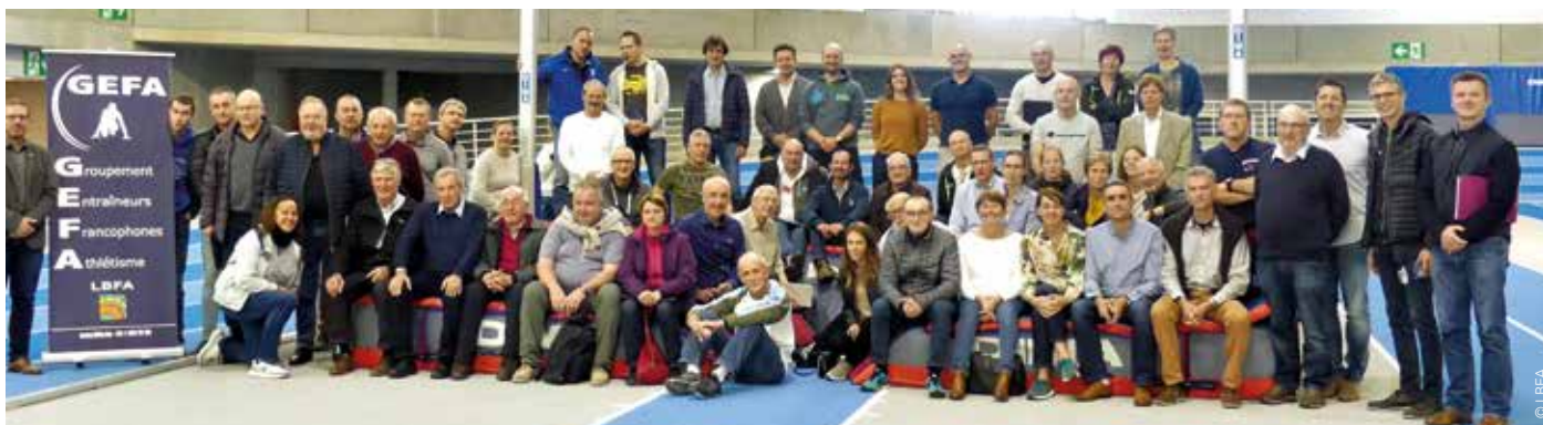
Le Groupement des Entraîneurs Francophones d'Athlétisme (GEFA) au grand complet autour de son président, une dynamique consacrée au service de l'athlétisme belge.

DANS CE NUMÉRO, LA REVUE DE L'AEFA POURSUIT SON ITINÉRAIRE VERS D'AUTRES ATHLÉTISMES ANNONCIATEURS DE PERFORMANCES INTERNATIONALES ET DE BONNES PRATIQUES LAISSANT LIBRE COURS AUX SOURIRES, AUX ÉMOTIONS ET PARFOIS AUX DÉCONVENUES... APRÈS LA SUISSE ET L'ESPAGNE, C'EST AU TOUR DE LA BELGIQUE FRANCOPHONE DE NOUS LIVRER SES RECETTES DE FONCTIONNEMENT. CET "ATHLÉTISME D'AILLEURS" JUSTIFIE PLEINEMENT LE MOT DE ROBERT SABATIER : " L'UNIVERS EST UN COMPOSÉ D'EXCEPTIONS QUI NE TROUVENT PAS DE RÈGLE À CONFIRMER. "ALORS, DÉCOUVRONS ENSEMBLE.